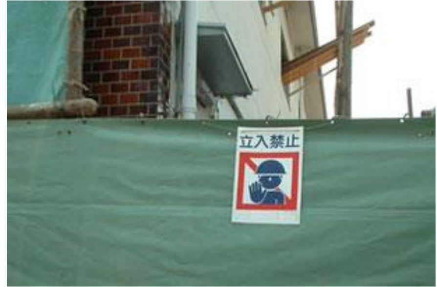
工事期間中は安全対策を怠りません。