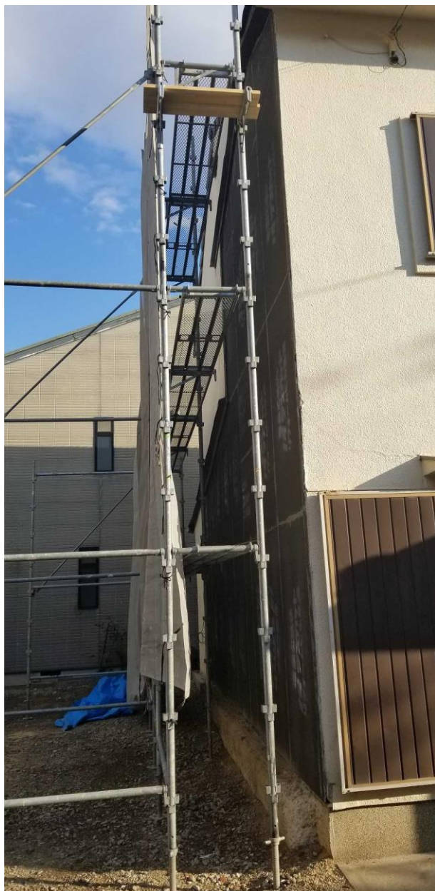
⑥下地のラスベニヤ貼り