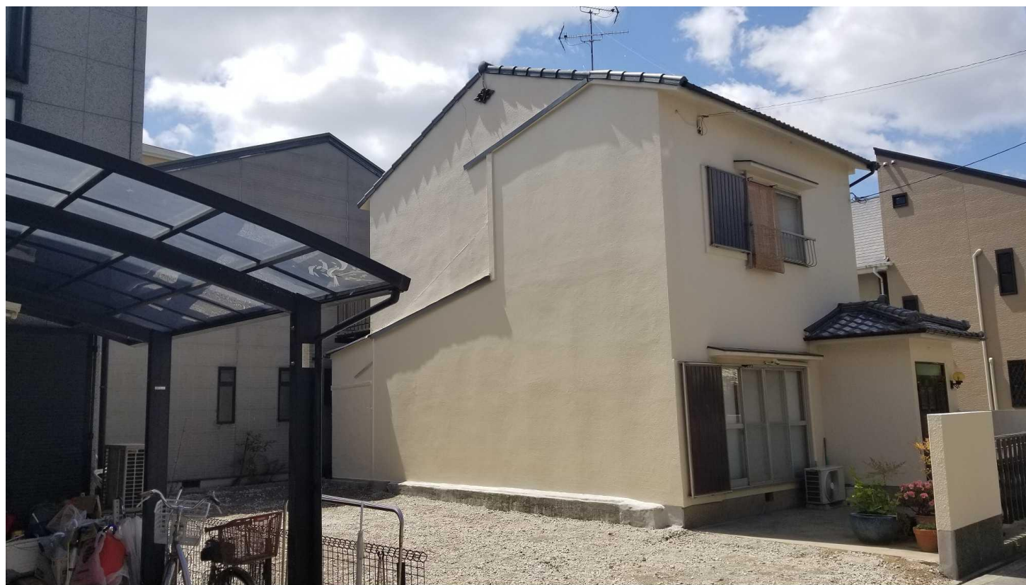
⑨作業足場を撤去して完了