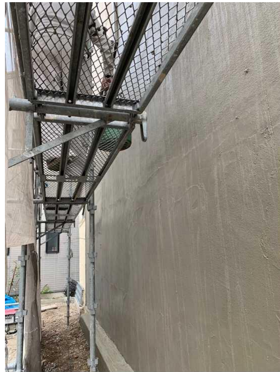
⑦左官工事：モルタル塗り