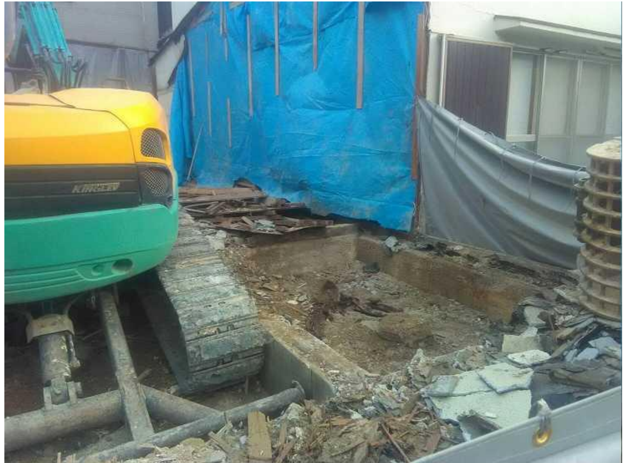
④雨養生の為、残す家屋の切り取り面にブルーシート張り